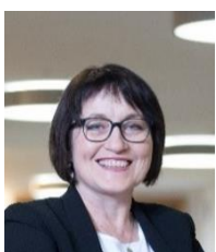
Hochparterre Irène Jud