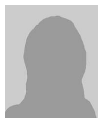
Restaurant Florence Keller